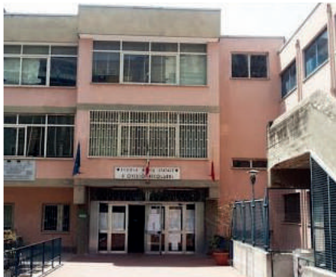
L'istituto scolastico D'Ovidio-Nicolardi