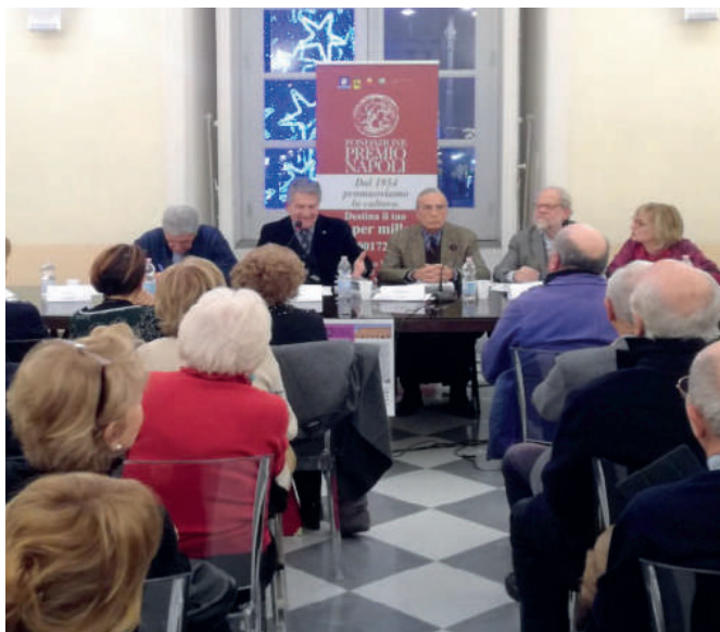
La presentazione nella sede della Fondazione Premio Napoli