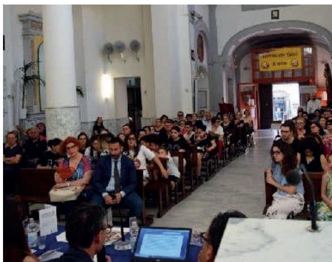
La cerimonia finale della prima edizione del premio

Il concorso è indirizzato a due categorie di autori: studenti dell'ultimo anno della scuola primaria e della scuola secondaria di primo grado; autori italiani e stranieri senza limiti di età. La gara si articola in due sezioni. Per la sezione A di poesia in lingua italiana o napoletana edita o inedita, la traccia è "Napoli mia. La vita nei quartieri" e si possono inviare non più di due poesie che riguardino aspetti positivi o negativi