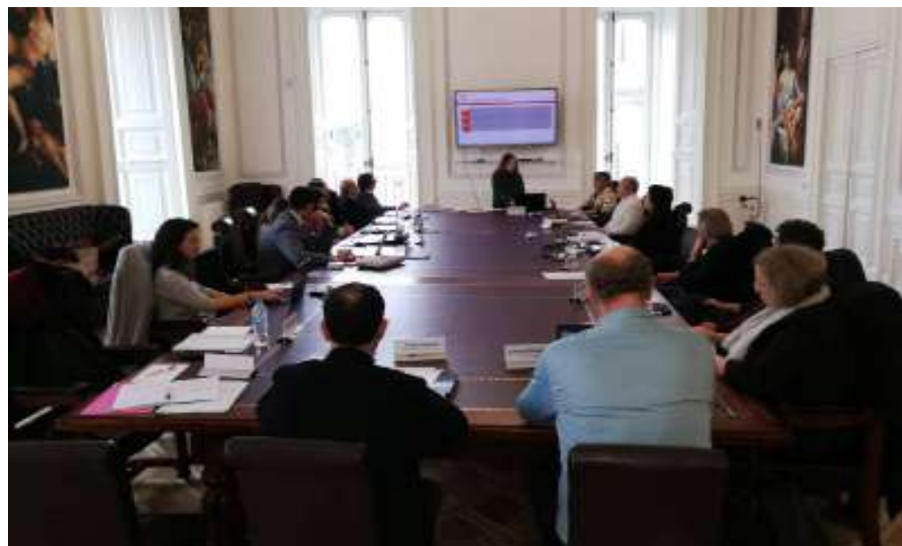
In foto un momento della riunione operativa dell'associazione indipendente Noi-Napoli Open Innovation sull'innovazione in Campania

Densò il programma del prossimo decennio, che tra l'altro vedrà l'Associazione impegnata in attività strategiche per lo sviluppo di una cultura dell'innovazione quali il tutoring per i tesisti impegnati nell'Open Innovation, grazie ad accordi con Atenei e Dipartimenti; una ricerca sulla normativa e sulla finanza a sostegno delle iniziative di sviluppo dell'innovazione riguardanti le Pmi della Campania e le amministrazioni locali; lo studio sull'innovazione collaborativa, le tecnologie dell'informazione e della comunicazione a sostegno dello