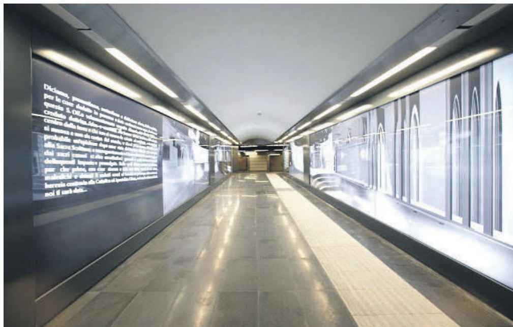
Una stazione della Linea 6

Con la delibera si approva inoltre anche il programma generale che prevede una prima attivazione fino a San Pasquale a partire da novembre 2020, con un esercizio di 6 veicoli, con cadenzamento a 9 minuti e capacità di trasporto di circa 1300 passeggeri per ora