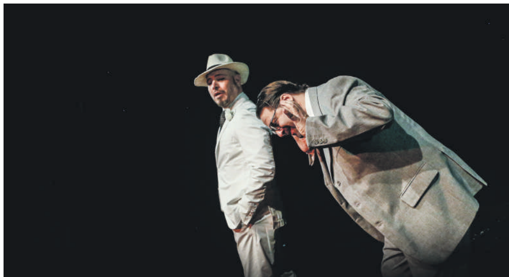
Un momento dello spettacolo “Don Giovanni” in scena al Teatro Tram

Dopo il Barbiere di Siviglia, si arriva così al secondo capitolo di un'ideale Trilogia Sivigliana con un testo che riassume con misura i tre aspetti delle tre principali versioni di questo mito moderno: se Mozart, grazie al libretto di Lorenzo Da Ponte, lo rappresenta come un gaudente “sciupafemmine”, lo spessore che la penna caustica ed anarchica di Molière ci offre, restituisce il ritratto di un uomo libero e senza freni, un anticipatore della filosofia illuminista, che riesce a sfidare società e benpensanti con provocazioni che vanno ben oltre l'ars amandi del suo prototipo, già raccontato da Tirso de Molina nella sua farsa. A lui si contrappone il suo servitore, Sganarello, maschera utilizzata da Molière, il cui