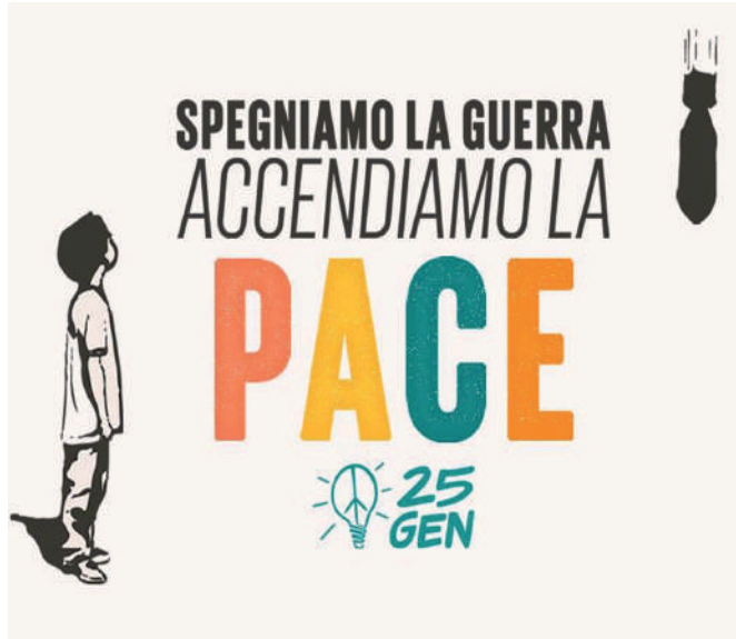
'a jurnata 'e prutesta contr'ò periculo 'e na guerra cu ll'Irà

Diceva nu proverbio antico: "Ntiempo 'e guerra, busciè comm' 'a terra". Pecché overo 'a guerra s'abbasa 'ncopp'è bbuscie, campa 'e fauzarie, se nutreca 'e 'mbruoglie. Tanno se parlava sulo 'e prupaganda, fatta apposta pe cummencere 'a ggente ca nun se puteva fa' a mmeno d'addefennere 'e cunfine d' 'a Patria d' 'e nemmice c' 'a vulevano assardà e ccunquistà. Ma 'a vecchia prupaganda è stata appassata d' 'e nnove tecniche 'e guerra psicologica (Psy-Ops), c'ausano tutt' 'e mmaniére pe nun ce fa sapé 'a verità e ppe spannere fauzarie. Oggi 'nfatte, pure grazie a Internét e è social media, ce sentimmo ammenacciate e ce simmo fatte capace ca simmo atturniate 'a terroriste, nemmice, assurpature, gente cuntraria a ll'interesse nuosto. Ma nunn abbastanza 'e bbuscie. 'E media assaje spisso nu' tteneno manco besugno d' 'e ddicere: abbasta ca nu' ccontano 'a verità e cca nun riportano