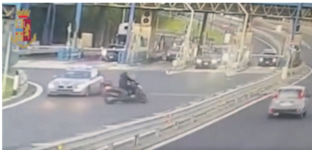
Due frame del video in cui si vede il centauro andare contromano in Tangenziale

centauro si è immesso in un by pass dirigendosi nuovamente in Tangenziale in direzione Capodichino per poi uscire ai caselli di Fuorigrotta riuscendo a dileguarsi