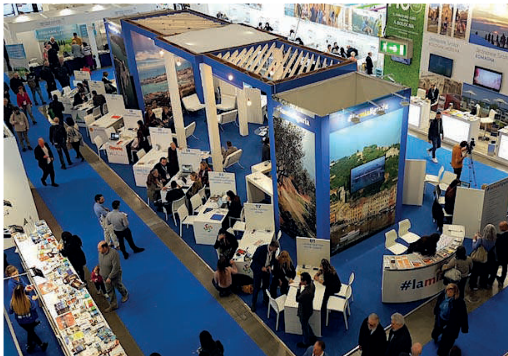
Gli stand della Borsa Internazionale del Turismo di Milano