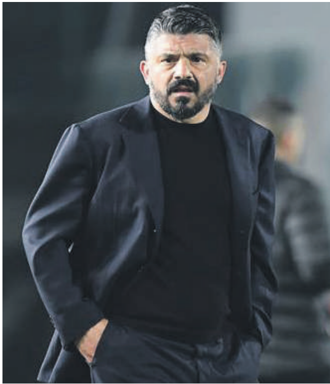
Gennaro Gattuso, ieri a Brescia

"A fine mercato ho ringraziato la società che mi ha preso giocatori importanti. Pensiamo partita dopo partita per arrivare subito a 40 punti. Per tanto tempo ho avuto paura perché vedevo una squadra fragile, senza sicurezze. Io sono nel mondo del calcio da anni e so che quando si spegne la luce è