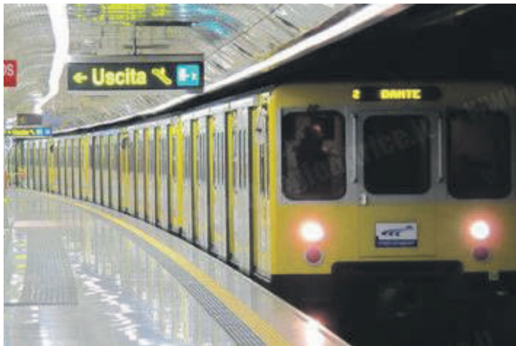
Un treno della Linea 1 della metropolitana

È un bel dire, da magistrato pensieroso sugli interessi dei cittadini. Ma come si farà ad affrontare questi problemi nel minor tempo possibile è obiettivo assolutamente impraticabile. L'Anm, partecipata del Comune, che gestisce la metro, non ha quattrini ed è stato appena e a stento salvata dal fallimento. Sono stati ordinati un po' di treni nuovi, ma nessuno sa esattamente quanto arriveranno. E nel frattempo si va avanti con i vecchi, che si riducono ogni giorno di numero, perché alcune vetture sono ormai non più riparabili. Solo negli ultimi giorni si sono verificati gli ennesimi problemi. Giovedì l'impianto è rimasto interamente paralizzato per un paio di ore, ieri il tratto da Garibaldi a Salvator Rosa è