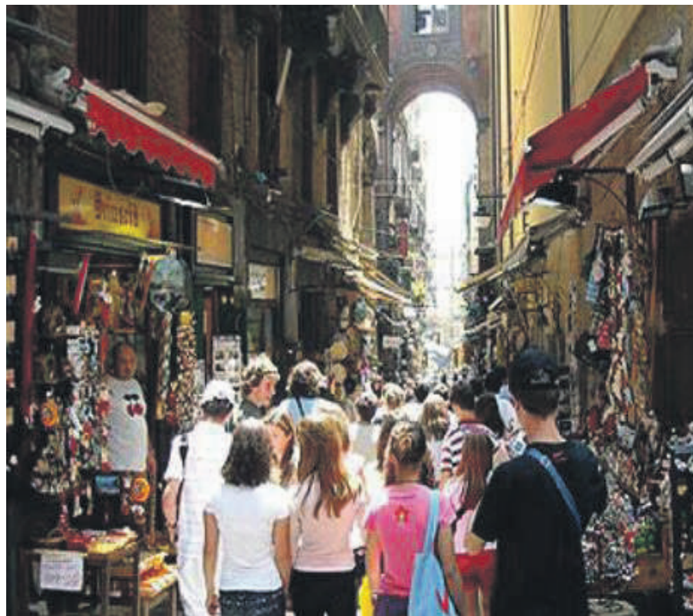
Il Centro storico di Napoli

In Campania, nonostante il forte calo delle attività del commercio non specializzato (in media una riduzione del -12%), tiene il numero delle imprese grazie all'incremento del settore ricetti-